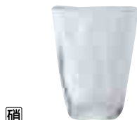
硝子 [5220-05] 400円 2100-6692 タンブラー 300ml (80×106) B3K16 CT48