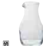
硝子 [5220-12] 500円 2100-2204 冷酒カラフェ 305ml (50×129) B3K12 CT36