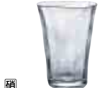
硝子 [5220-24] 500円 2100-6646 タンブラー (M) 300ml (90×120) B3K16 CT48