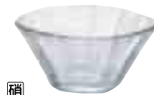
硝子 [5220-27] 400円 2100-6314 12cm 小鉢 (120×55) B3K16 CT48