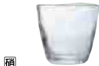
硝子 [5220-03] 400円 2100-6690 フリーカップ 210ml (80×73) B3K16 CT48