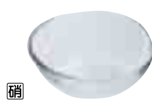
硝子 [5220-14] 400円 2100-6282 13cm 小鉢 (130×45) B3K16 CT48