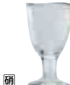
硝子 [5220-10] 500円 2100-6694 台付グラス 170ml (75×125) B3K16 CT48