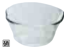
硝子 [5220-16] 600円 2100-6259 17cm 深鉢 (170×80) B3K8 CT24