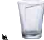
硝子 [5220-20] 500円 2100-6635 タンブラー300ml (90×86×111) B3K16 CT48