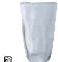
硝子 [5220-06] 500円 2100-6695 タンブラー 370ml (83×131) B3K16 CT48