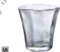
硝子 [5220-23] 500円 2100-6644 フリーカップ 240ml (93×90) B3K16 CT48