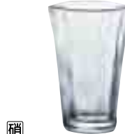
硝子 [5220-25] 600円 2100-6645 タンブラー (L) 420ml (96×137) B3K12 CT36