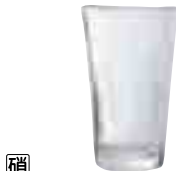
硝子 [5220-02] 400円 2100-6691 タンブラー 170ml (67×105) B3K16 CT48