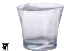
硝子 [5220-18] 400円 2100-6633 フリーカップ 200ml (88×84×82) B3K16 CT48