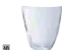
硝子 [5220-04] 400円 2100-6696 フリーカップ (L) 240ml (86×90) B3K16 CT48