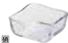
硝子 [5220-13] 500円 2100-6274 12cm 冷奴鉢 (120×120×45) B3K12 CT36