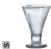
硝子 [5220-21] 500円 2100-6637 台付グラス 90ml (71×66×103) B3K16 CT48