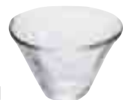
硝子 [5220-08] 400円 2100-6258 10cm 小付 (104×68) B3K16 CT48