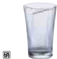
硝子 [5220-19] 400円 2100-6634 タンブラー (S) 180ml (74×68×112) B3K16 CT48