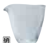
硝子 [5220-11] 600円 2100-6697 片口フリーカップ 240ml (96×86×90) B3K16 CT48