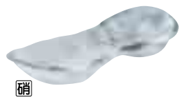
硝子 [5220-17] 500円 2100-6253 20cm つきだし (205×80) B3K8 CT24